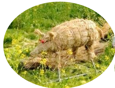
トトロは藤川 治美さん作