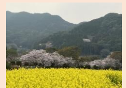
菜の花と桜（轟小前）