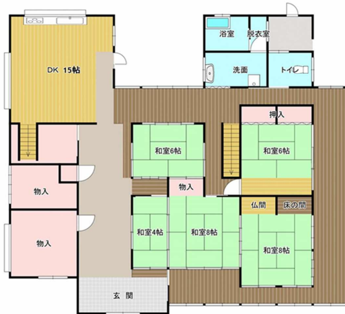
1階 ※現況と異なる場合は、現況を優先します。