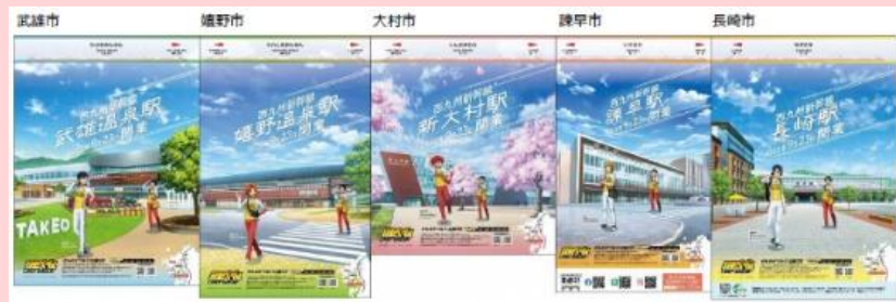
沿線5市の広報誌（2022年7月号）裏面をジャック

開業までの気運醸成を図るため、沿線5市内のあらゆる場所に西九州新幹線の開業をPRするコラボポスターやのぼりを掲出。缶バッジやポケットティッシュは各市の様々な関連イベント等にて配布