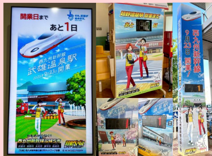
開業100日前からコラボVer.のカウントダウンボードを設置

開業までのPRとしてTwitter(現X)キャンペーンを実施 第1弾：4/26～6/17 第2弾：6/18～8/12