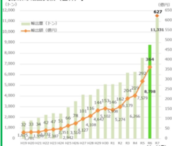
【緑茶の輸出価格の推移】