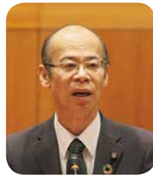
梶原 睦也 議員