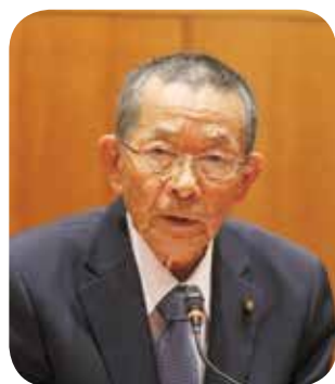
山口 虎太郎 議員