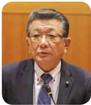
川内 聖二 議員