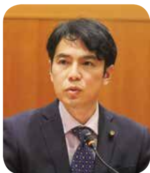
山口 卓也 議員