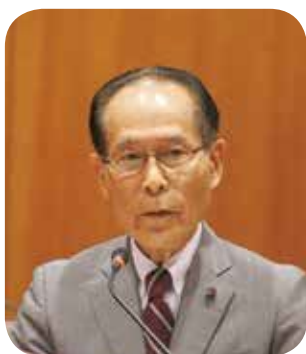
森田 明彦 議員