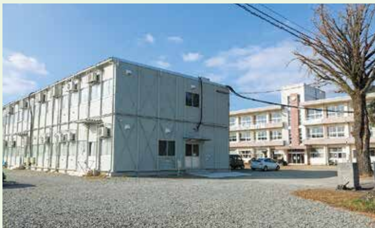
▲長寿命化改良工事に着手される大草野小学校