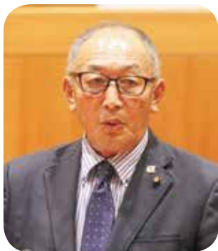
田中 政司 議員