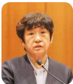
古川 英子 議員