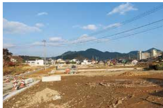
▲ 移住・定住に大いに期待

問 宅地開発の場所は。 答 塩田地区に2カ所（2事業者）、嬉野地区に大規模開発1カ所である。