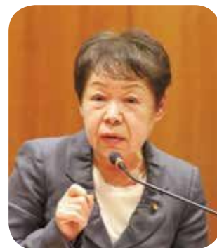
芦塚 典子 議員