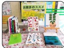
▲特集コーナーの例