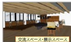
交流スペース・展示スペース

(関係団体) 地域包括支援センター、障害者等相談支援センター、公民館事務室、社会福祉協議会、シルバー人材センターを予定