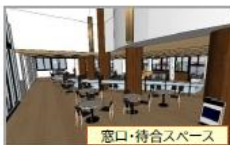
窓口・待合スペース