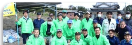
環境パトロールスタッフの皆さん

可燃ごみ 47袋 不燃ごみ 12袋 ピン・缶 20袋 テレビ1台 タイヤ 49本 炊飯器 2台 椅子 1脚 衣装ケース多数 その他の産業廃棄物も