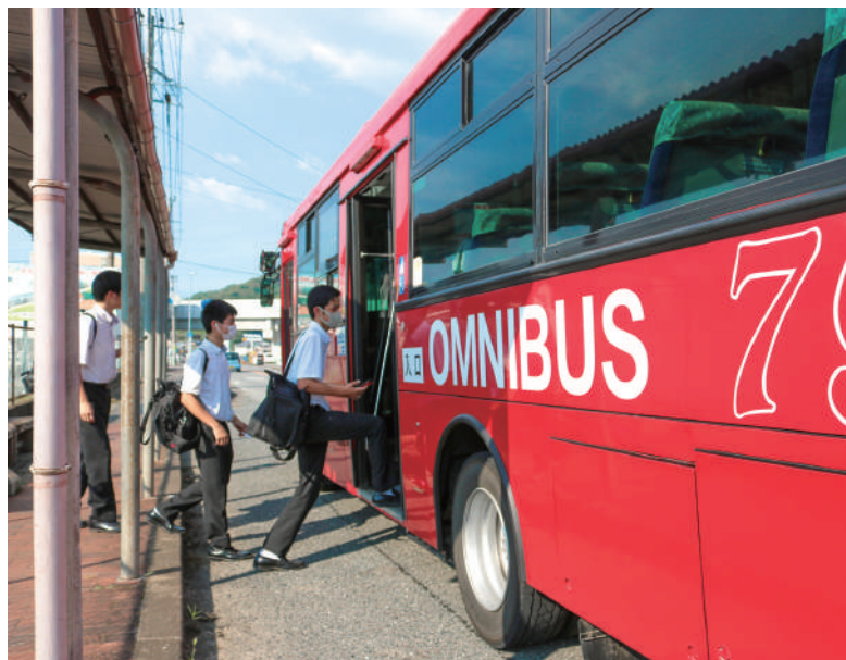
▲高校生にも通学支援を