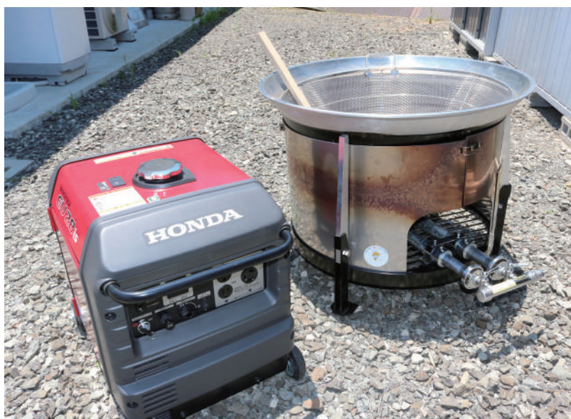
▲非常時に備えた備品の充実

「地域防災組織育成助成事業」 自主防災組織育成助成事業として大草野地域コミュニティ運営協議会へ移動かまど他、防災資機材費として180万円の助成が決定されたものです。 更なる地域コミュニティ活動の充実が期待されます。