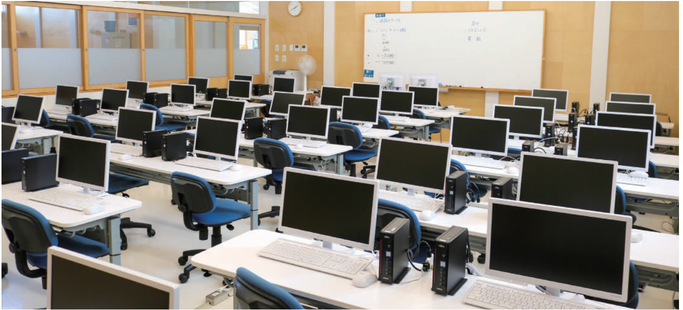
▲現在の教育 ICT 環境 (塩田中学校)