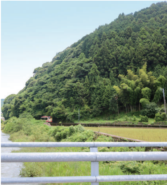
▲危険箇所の防災対策を