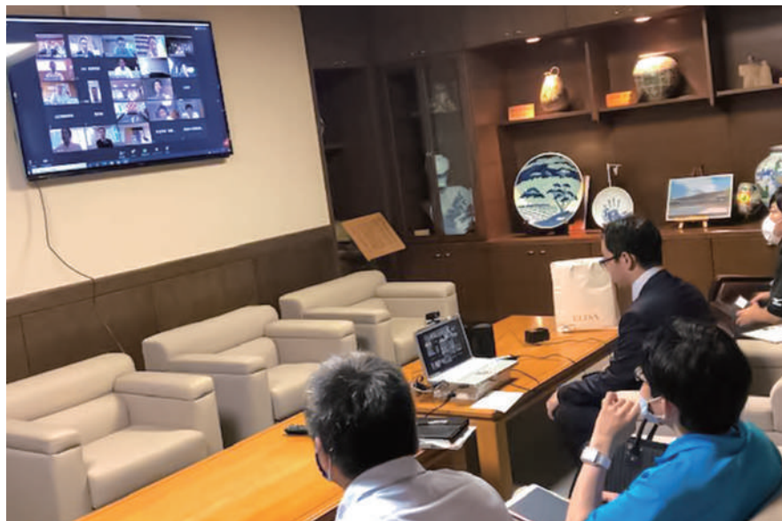
▲市民サービスが低下しないように

新型コロナウイルス感染症の影響により、職員の「働き方改革」の推進や行政サービスの持続性を確保するために、庁舎外から自宅パソコンへのリモートアクセスが可能になるように環境を整備する事業です。