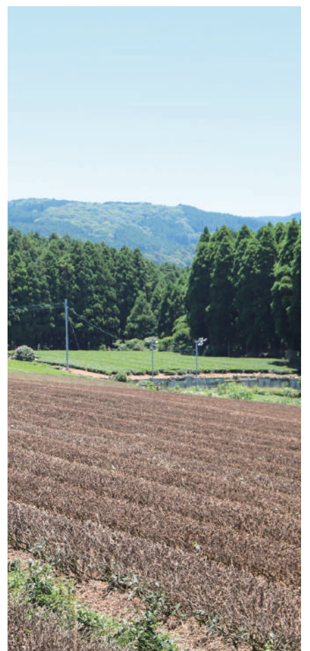
▲農業への支援策を

山口 経済対策の一環として実施した「〇inうれしの」が即完売の好評だったが、追加予算を組