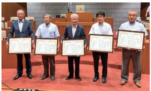
▲表彰された5名の議員