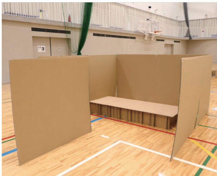
▲プライバシーに配慮した間仕切り

事業の内容は、嬉野市内の主な避難所における、感染防止のために、段ボール間仕切り230セット、簡易ベッド60台の避難所運営資機材を購入し、密集回避や飛沫拡散の抑制に資するものです。