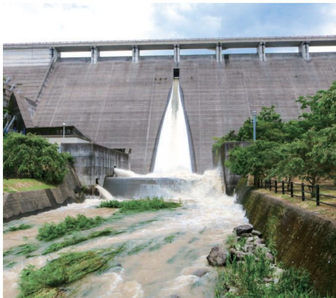
▲雨期前のダム事前放流を