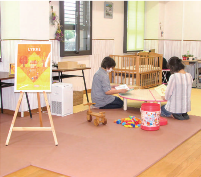
▲環境整備の充実を

者の声を伺うと、リュックの存在を知らない、畳の部屋がいいなどの声があった。リュックを知ってもらうためにも、子育て関係機関の情報共有の場としての連絡会開催が必要と思われるがいかがか。