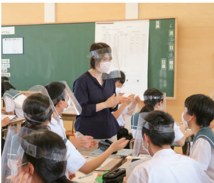
▲フェイスシールドでの感染症予防対策