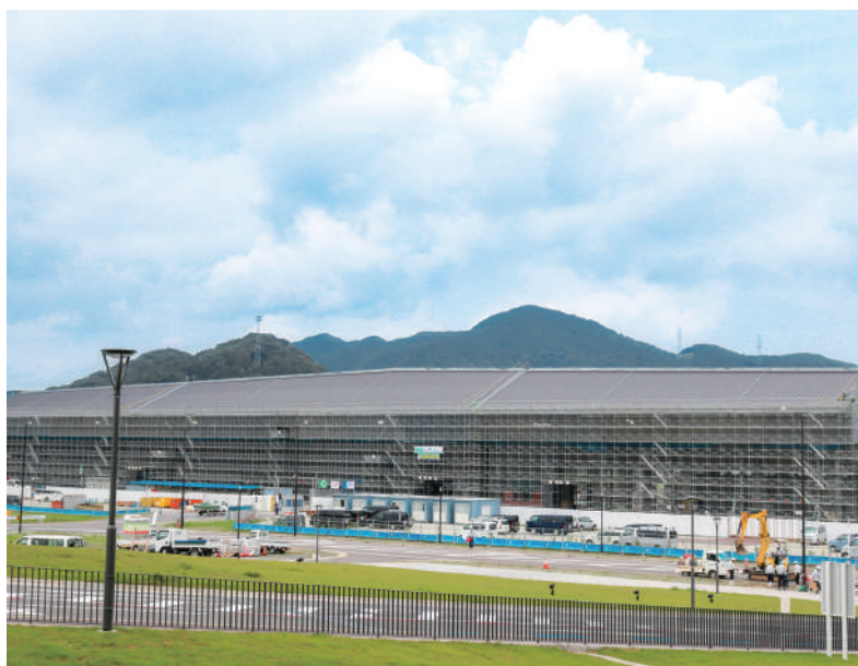
▲ 2022年度の開業に向けて

宮崎 緊急事態宣言が出された経緯を考えれば、未曾有の災害と言っても過言ではない。市職員の業務も明らかに増大しており、また、国や県の事業においても職員が一番矢面に立たされて説明をしている状況にある。今後の業務遂行、市民サービスに万全の体制で臨めるように、職員の健康状態及びストレスチェック