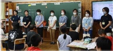
8名のサポーターさんで

5年生の手縫いサポーターがありました。ほとんどの児童が糸と針で布を縫うことは初めての体験ではないでしょうか。 4名ずつ7班に分かれてそれぞれの班にサポーターが ついてお手伝いをします。担任の先生から説明を受けて、さあ実践となります。 みんな一生懸命に慣れない手つきで頑張りますが、教えてくださる方が多いのは本当にいいなあと取材していると思います。これを担任の先生だけで教えるとなつたら・ 地域連携の良さを実感する授業でした。