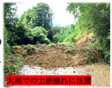
大雨での土砂崩れに注意

6月29日から7月1日までに、嬉野市は157.5ミリの大雨となりまして。堤ノ上から鍋野に向かう市道で土砂崩れが起き、現在も通行止めです。気象情報に注意し、自宅からの避難も大雨時の不要な外出も出来ないようにしましょう。