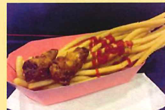
中崎水産 ふくダンロングポテト