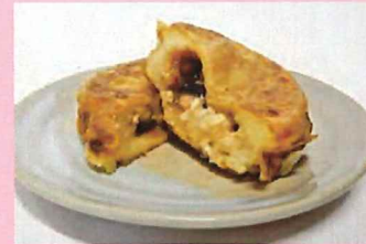
ファーマーズ いなほやき