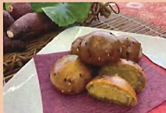
菓子処かわた 安納芋かりんとう饅頭