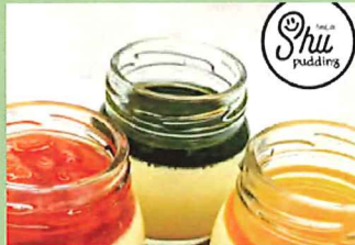
うれしの SHU pudding プリン各種