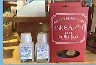
たけ推し とまらんパイ