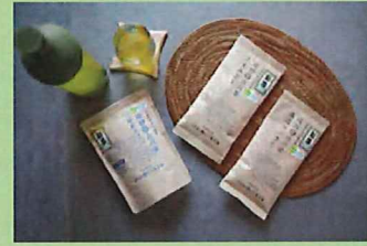
白川製茶園 嬉野茶