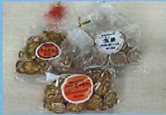
(株) 恵比寿堂 せんべい各種