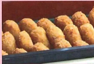
ナガスイ 愛のコロッケ