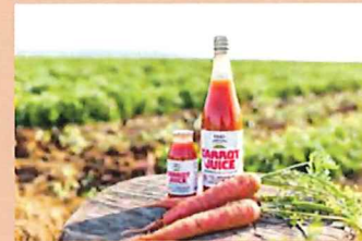
滝商店 キャロットジュース