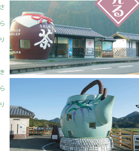
MAP P12-A-3, P12-E-3

0954-42-3310 (嬉野市観光商工課) 茶楽里/嬉野市嬉野町不動山甲8-6 器楽里/嬉野町吉田丁5190-1 ①各5台