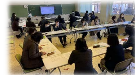
【嬉野中校区小中連携研修会】