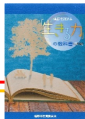
【生きる力の教科書】