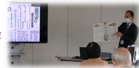
【校長によるプレゼンテーション】