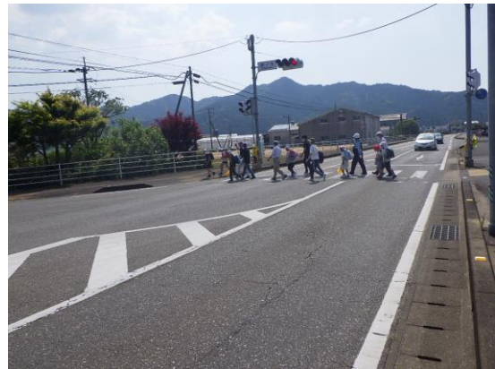
『信号を見て、左右を見て横断』