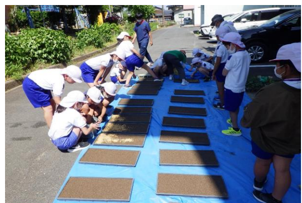
『パラパラとまくのが苦手です』