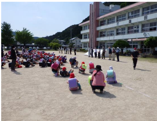
『真剣に駐在さんの話を聞く子供達』