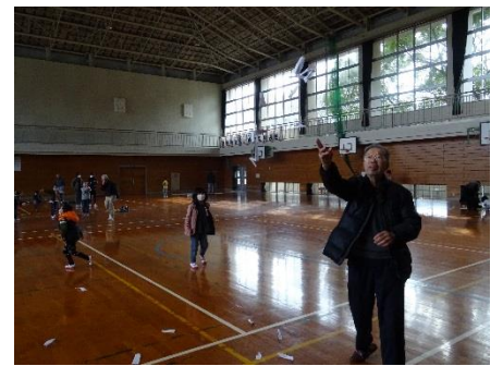
2018年轟小学校で1年生と昔遊び「紙ひこうき」