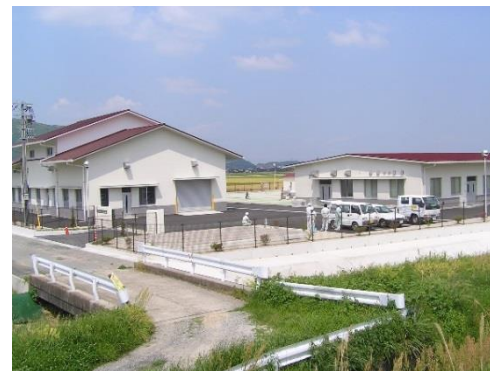
五町田・谷所地区処理場