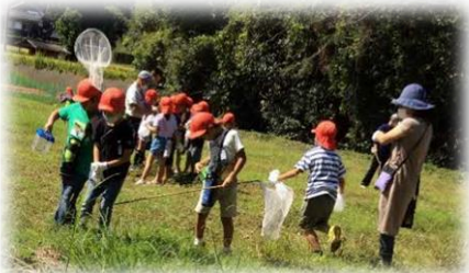
昆虫採集に頑張る2年生

9月29日(火)楽しみにしている2年生の期待にこたえようと、前日先生とザリガニ釣りを準備しました。はじめてザリガニにさわると、おそろおそろつかんでいました。コオロギなどもつかまえて、にぎやかに大きな楽しい声がひびいていました。