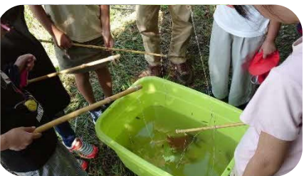
ザリガニ釣れたかな？