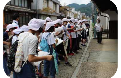
塩田津散策説明に聞き入る