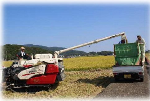
搬送車への積み替え作業