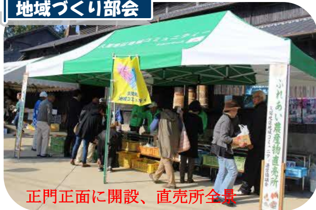
正門正面に開設、直売所全景

11月9日(土)・10日(日)の2日間日本遺産認定志田焼の里秋祭りに、コミュニティの新鮮野菜販売所を開設しました。地元久間地区の生産者のご協力で新鮮野菜や新米・もち米・キュウイフルーツ等々沢山の商品が店頭に並びました。今年是不順な天候の事情で生産がうまく出来なかつたとの事でしたが、たくさん出品していただき感謝でした。葉物などは飛ぶように売れて生産者に再度お願いしたりしました。売り上げは、123、950円でしたお買上ご協力有難うございました。生産者の出品ご協力感謝いたします。秋祭り入場者は1,267名でした。ご来場有難うございました。来年もお待ちしております。