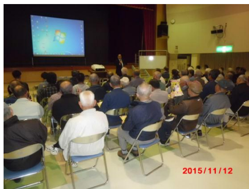
「交通安全・防犯講習会」