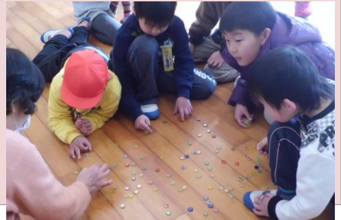
(昨年の小学校1年生の昔遊び風景)

「こんな事なら教えられるよ」・・・いままでの職業・趣味・生活などで自分が身につけた知識や技術を、地域の為に還元していただき学校をはじめとする様々な生涯学習の場で指導者として活動して頂く方を探しています。どんな小さな特技でも結構ですので、活動してみてください。