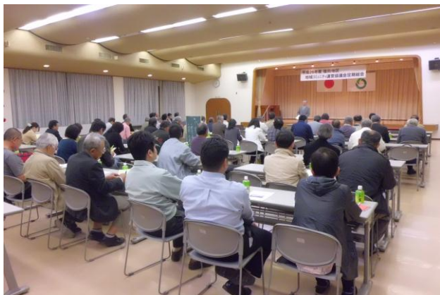
(会長の挨拶・出席者の方々)