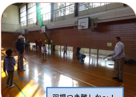
羽根つき難しいかっ!