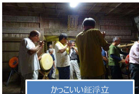
かっこいい鉦浮立