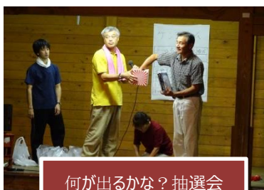
何が出るかな？抽選会

が難しいのです。隣りの鉦と息を合わせつつ、笛に従調性と思いやり。… 伝統は、年長者から若者へ、手取り足取り教え込まれてきまっています。