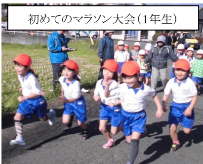
初めてのマラソン大会(1年生)

寒風吹き荒れる12月17日(木)、大草野小学校全校生徒によるマラソン大会が行われました。転倒したり等のアクシデントは有りましたが、みんな、力の限り走っていました。お疲れ様でした!