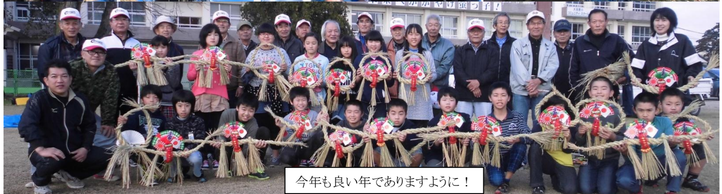
今年も良い年でありますように！