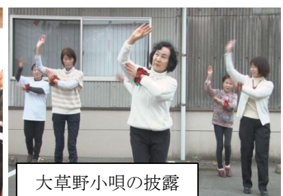
大草野小唄の披露