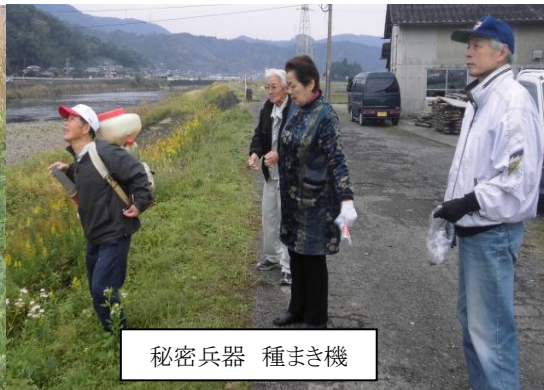
秘密兵器 種まき機