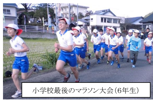
小学校最後のマラソン大会(6年生)