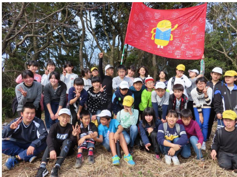
「寄せ書き」バックに全員で記念撮影(漏斗岳頂上)