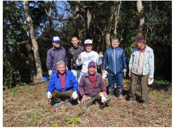
参加者の皆さん(頂上で)