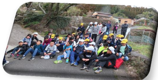
漏斗岳から無事に下ってきました!