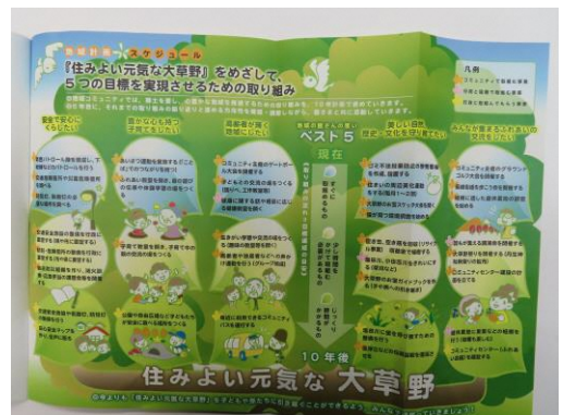
現在の「住みよい元気な大草野」めざして(5つの目標)

平成31年も早いもので二月が経過しましたが残るコミュニティの事業も残り二、三となりました。自身の力不足ながら皆様方のご協力のお蔭で何とか消化できたと思います。また、月日の過ぎるのは早いもので平成の時代を終えようとしています。次の元号は「何だろう！」などと期待する一方、少し寂しい気もします。ところで、前々回に「亥年は災害が多い」ということを記しましたが、気象庁の地震データによると二か月余り、震度五以上が三回（熊本二回、北海道胆振中東部）、震度四以上は八回起こっています。地震に限らず風水害等非常時に備えた訓練等を通して「自分自身の命は自分で守る」という意識を高めることが大切なことだと思います。