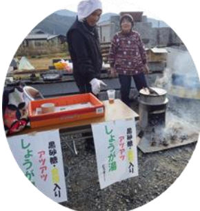
特製しょうが湯コーナー

昨年の暮れ、12月28日(日)郵便局横広場で、野菜販売&バザーを開催しました。お天気も上々で、開始1時間前から沢山の来場者があり、会場は笑顔と活気にあふれ、話声も弾み大賑わいでした。又、新たに「歳末助け合い運動」のバザーも実施、衣類・陶器・洗剤等沢山の品ぞろえがあり、手に取って品定めをしている姿がたくさんありました。会場の寒い中、美味しい特製しょうが湯の振る舞いに心がほっかほっかになって、風の予防にも成るとの事で、沢山の方々喜んで味わっておられる姿が印象的でした。