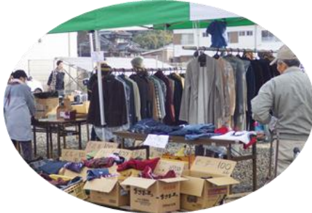
初めてのバザーコーナー