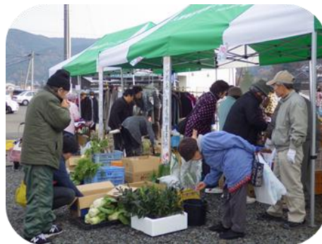
野菜販売コーナー