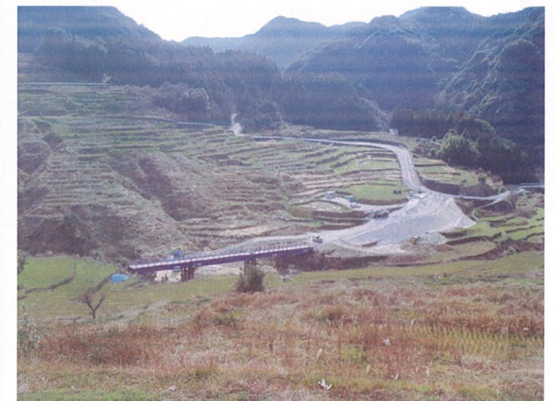
俵坂トンネル出口 仮橋