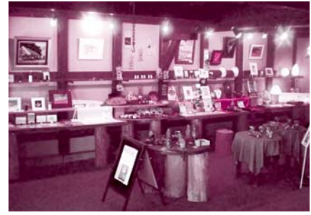
塩田津ミュージアム

国の伝統的建造物群保存地区である「嬉野市塩田津」の町並みに賑わいと魅力ある町にしていくために、嬉野市商工会が取り組む商店街空き店舗活用「賑わい創出事業」において、修理・修景された家屋を活用したお店が開店しています。一つは吉富家を借りて作られた「塩田津ミュージアム」。嬉野市在住者の方が中心で絵画、銀細工、フェルト加工、押し花絵、和紙細工品、布細工品等々の高い技術を持った作品が展示されています。手頃な価格で来訪者にとっては魅力です。