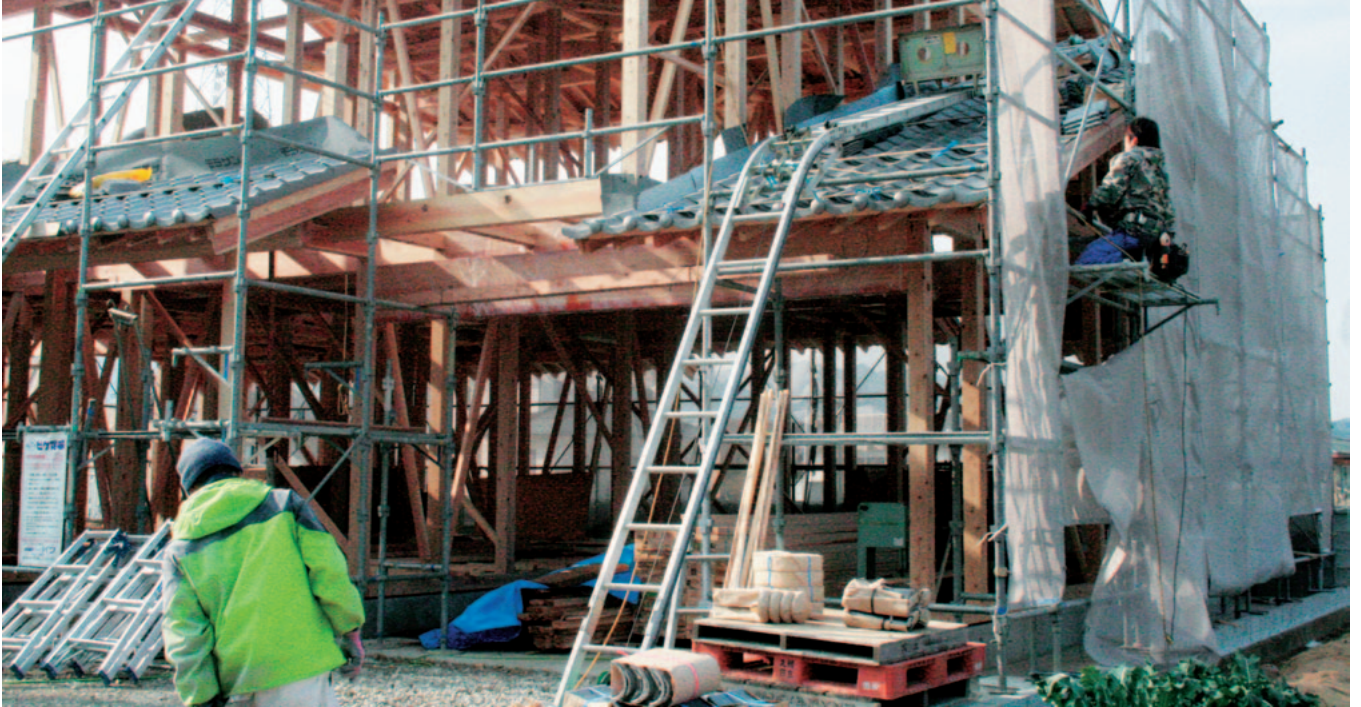
▲人口増につながるか（新築住宅の風景）