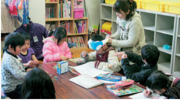
▲放課後児童クラブで楽しむ子ども達

事業に要する費用に充てるため、地方自治法の規定に基づき、嬉野市放課後児童クラブの利用者負担金を徴収することにし、必要な事項を定めるものである。