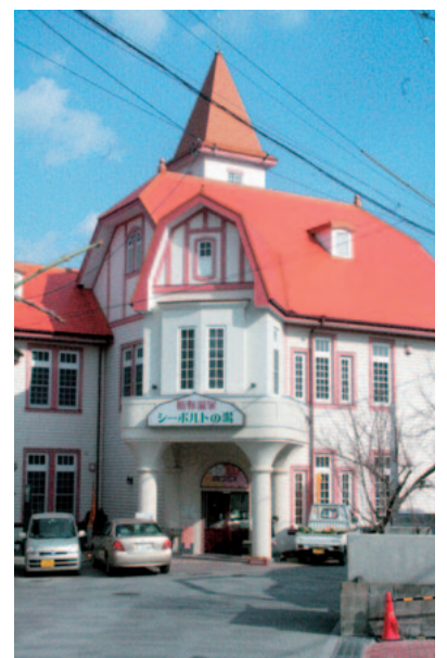
▲嬉野温泉のシンボル「シーボルトの湯」