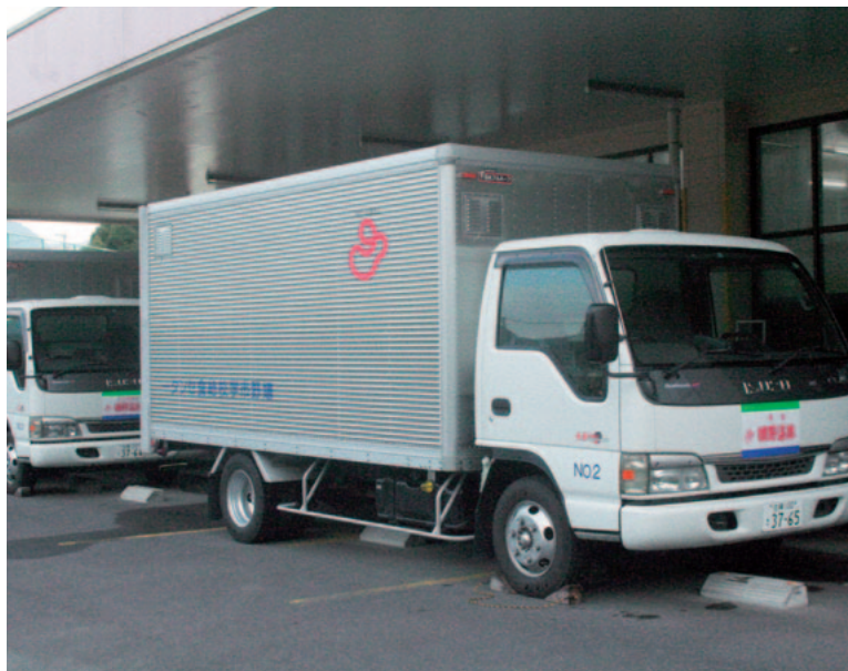
▲給食になくてもならない配送車

総務課長 市内で46件の宿泊施設があり、避難訓練実施した施設は34件、未実施の旅館・ホテルは消防署や旅館組合などから防火対策の指示をする。