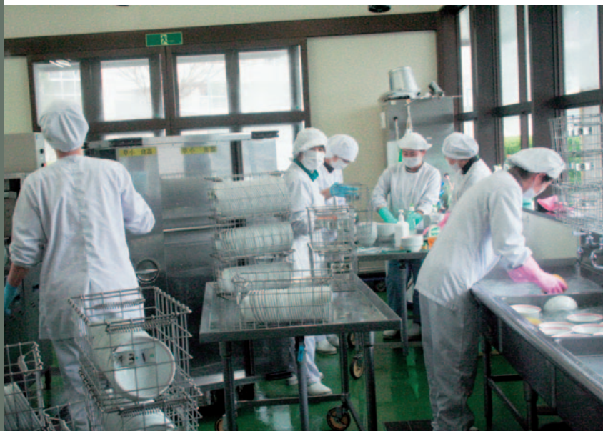
▲給食業務に励む調理員さん