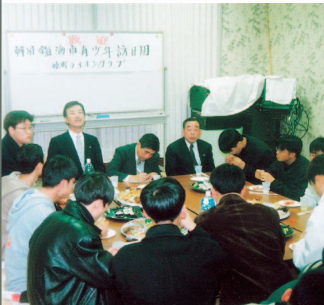
▲韓国の子ども達との交流光景