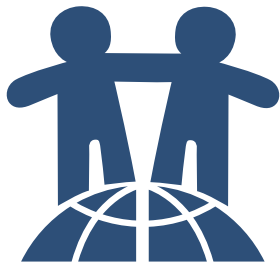
人権擁護活動シンボルマーク