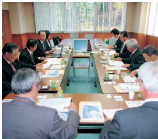
▲魚沼市でクラウドの説明を受ける総務企画委員

自治体クラウドは各自治体において様々な取り組みが行われているが、先進的な取り組みを展開している新潟県三条市と魚沼市を視察研修した。なお、視察に先立ち杵藤電子計算センターにて事前に研修を行った。温泉水発電についても視察を予定していたが、残念ながら当該施設が工事中のため中止せざるをえなかった。