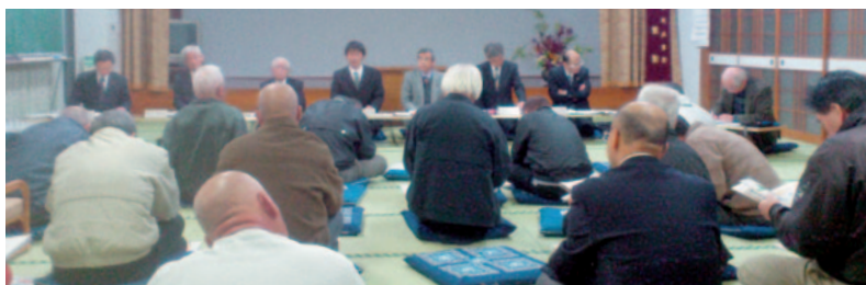
▲大草野地区での議員とかたろう会