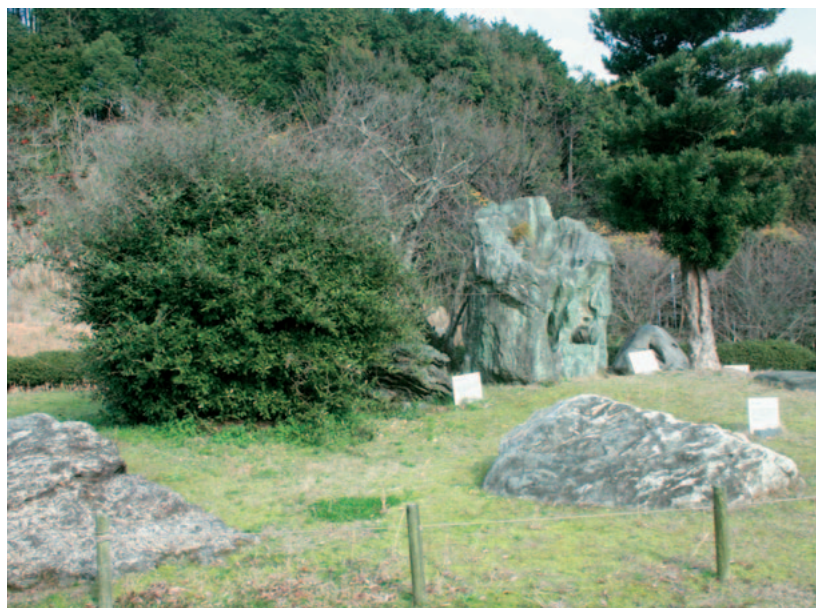
▲寄贈された嬉野小の銘石

言われているように、各種の情報入手や発信が重要である。特に発信については、あらゆる媒体を通じて積極的に発信していくべきではないか。