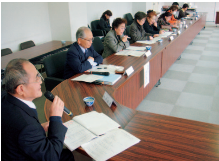
▲視察対応をされる民生委員会