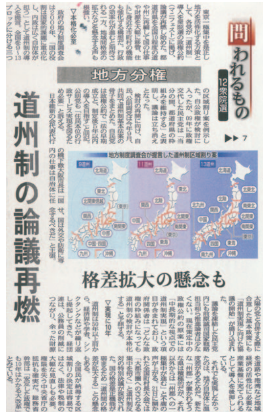
▲道州制問題を掲載した新聞記事