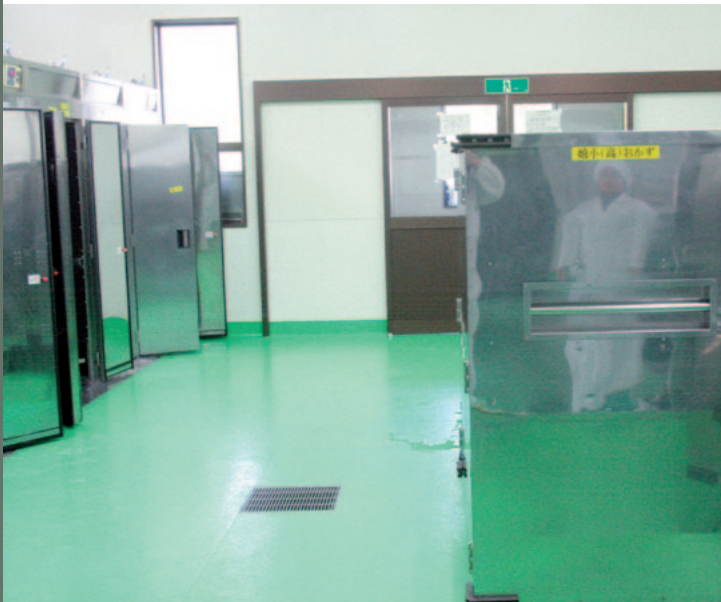
▲窮屈になるコンテナ置場（嬉野給食センター）