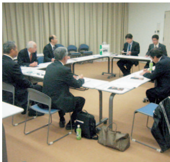
▲京都市教育委員会で研修する文教厚生委員