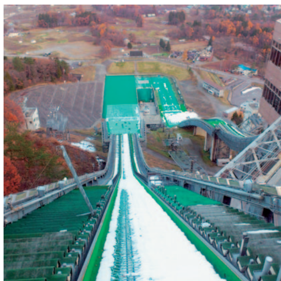
▲白馬村のシンボルであるスキージャンプ台

今後、嬉野市が観光を市の産業の大きな柱として考え、新幹線の開通などを契機に「街中に笑顔があふれ、暮らす人も訪ねる人も、嬉しくなるような活気あふれる街」を目指すためには、観光推進のための「目的と目標を明確化」し、市民全体がそれに向かい気持ちを一つにできるような振興策と取り組みが必要があるうし、それを具現化する組織の在り方として、官民一体となつた白馬村観光局の取り組みは大いに参考にすべきと考え