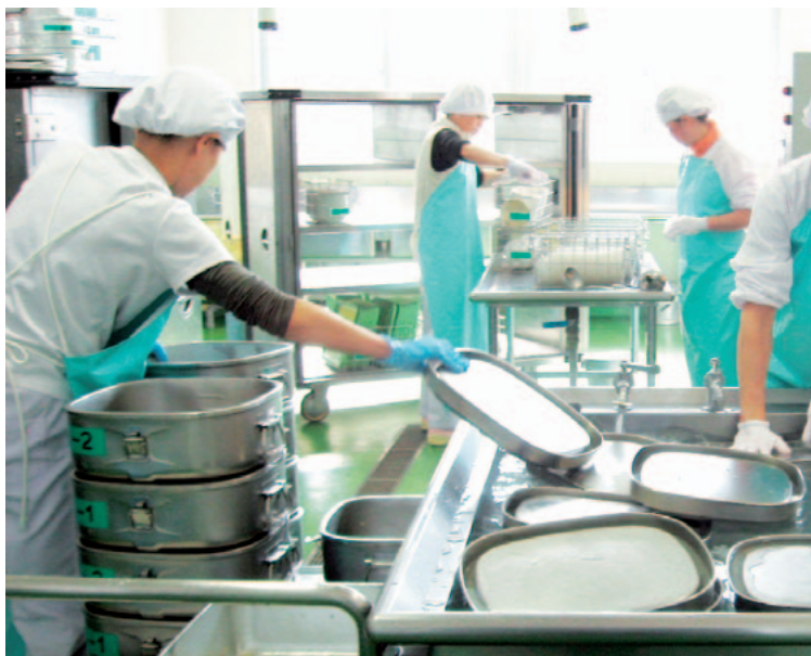
▲どうなる塩田学校給食センター

平野 塩田町民や議会から、給食センター統合に反対意見が続出し大きな問題となっている。子どももの成長期に安心・安全を聞いている。統合につ