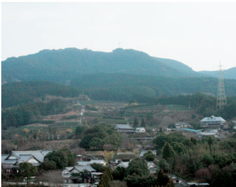
▲記念植樹の森が欲しい立岩展望台

梶原 最大調理数ではない現状でもぎりぎりの運営がなされている。限度を超えた状態の中、多少の改修だけでは適正な配食は無理ではないか。現場を何度も見たが、コンテナ1つを出すのも大変な状況にあり、天ぷらを揚げる大きな鍋の間隔も狭く、調理員さんの安全