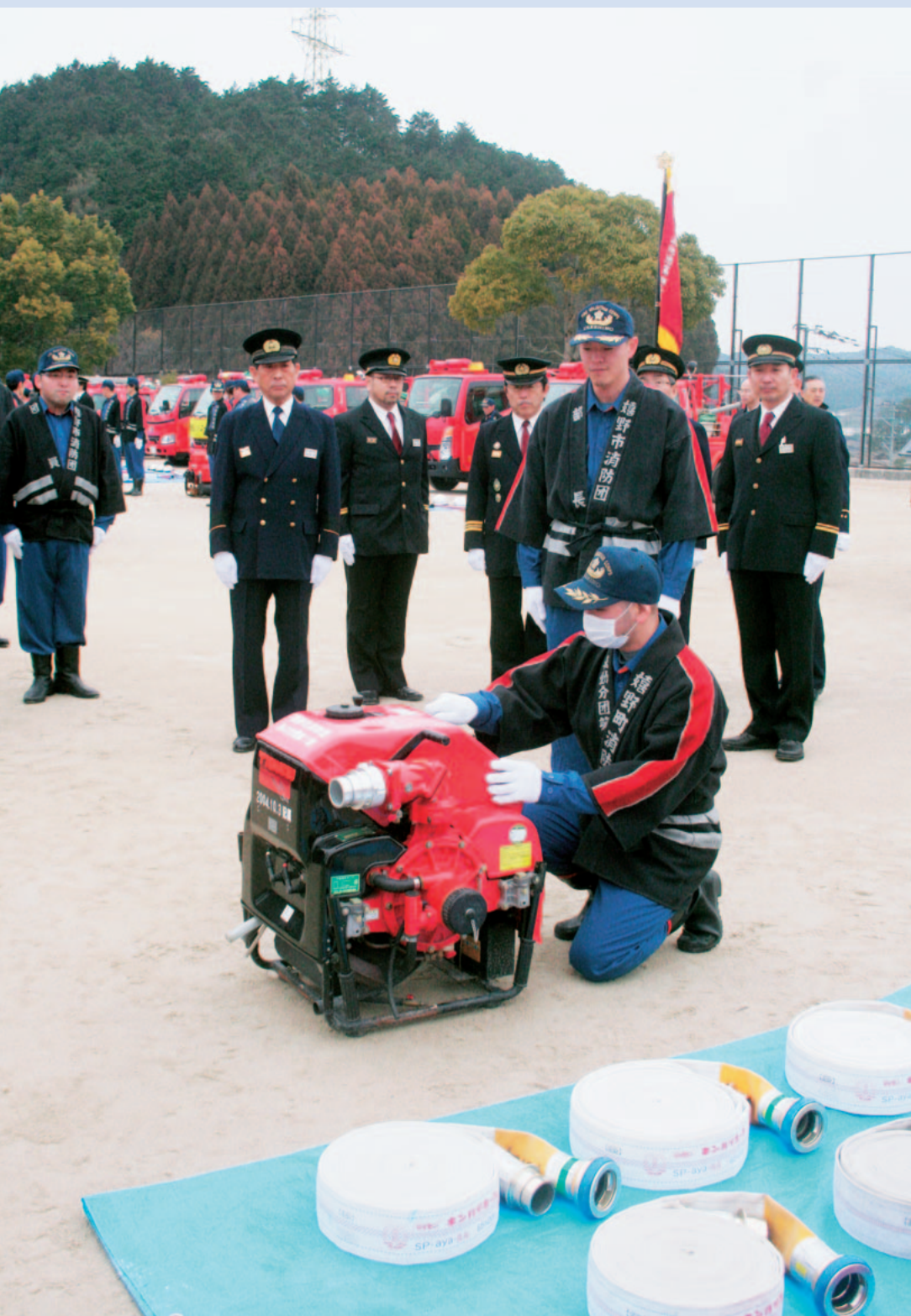
▲消防出初式での機械器具点検