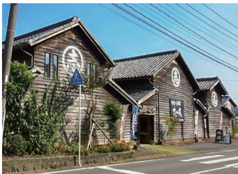
▲佐賀県遺産に認定された志田の蔵