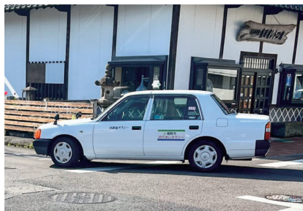
▲利用者の利便性のために

その中でも上久間線の利用低迷を受け、周辺の公共交通空白地域への対応も念頭に、塩田地区全