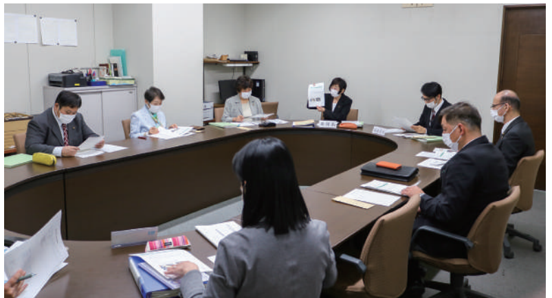
▲議会の活性化に向けて