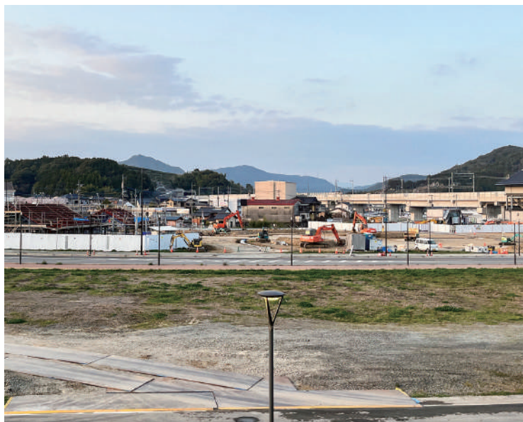
▲新たな交流拠点として

交通情報等を提供します。それとともに、観光などの地域情報の発信により市民と来訪者との交流を促進し、地域の振興および活性化を図ります。嬉野温泉駅利用者への利便性の向上のためにも、