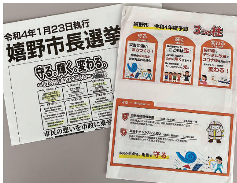
▲政策の実現に努めよ

市長 4年間連続して大雨特別警報が出て、昨年8月の豪雨災害での大規模な被災を教訓に、災害対策のハード面はもとより、避難指示の在り方に対して、もう1歩進んだ取り組みと、いろいろな情報技術を活用した防災DXという観点を最優先事項におこないたい。