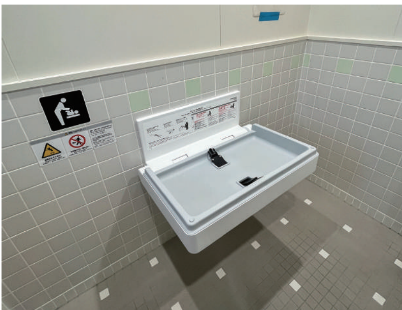
▲オムツ交換台があるとゆっくり遊べるね

国道498号の整備期成会があり、沿線4市の鹿島市、武雄市、伊万里市の4市長で要望している。鹿島市からは、利便性の高い道路開通の要望もある。トータルの鹿島―武雄間の早期開通と併せて、下久間の現道拡幅については、どんな条件になろうとも、是非とも実現してほしいと強く要望していきたい。