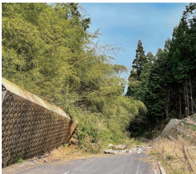
▲早い復旧が望まれる市道

市道木場内野山線については、令和3年度予算で6220万円の予算が計上され、令和4年度に繰越明許されました。今後の予定は雨期前に