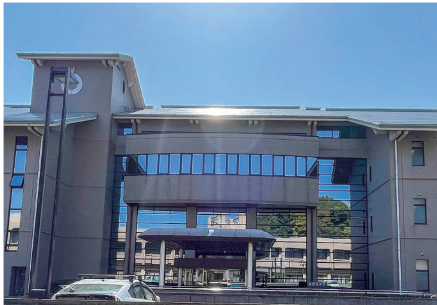
▲身近な市民サービスの充実を目指す

市長 時代に合わせた考え方で、また、お困りになられている方の声も聞きながら、近隣市町の制度も参考にしながら考えていきたい。