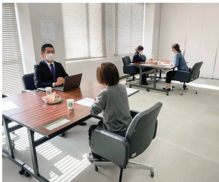
▲隙間時間を活用して

当市においても、新型コロナウイルス感染症の影響に伴い、あらゆる事業所において、繁忙期と閑散時期が急速に入れかわるなど雇用形態に関して不安定な状況となっている現状を緩和する事業と考えます。