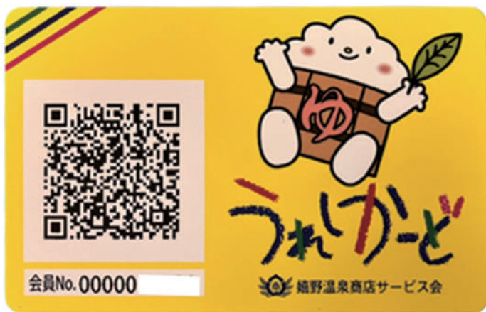
▲市内経済の活性化を目指して