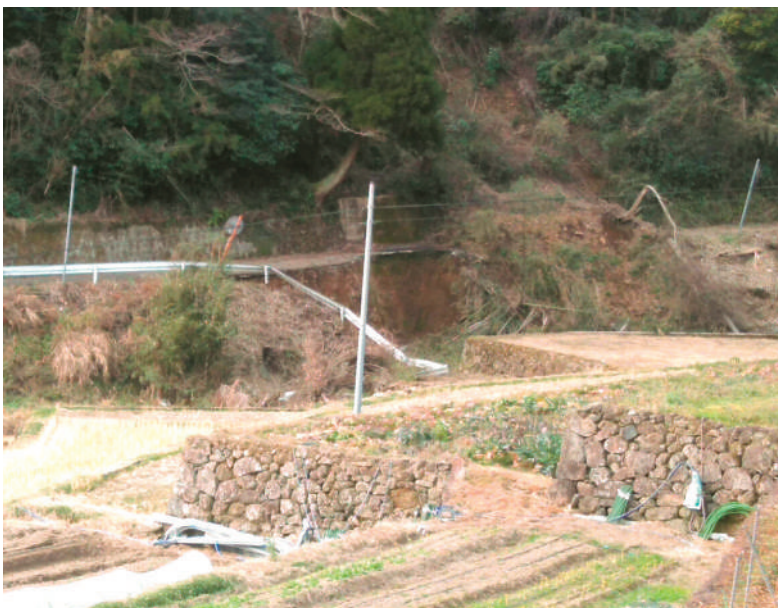
▲早急な復旧が望まれる