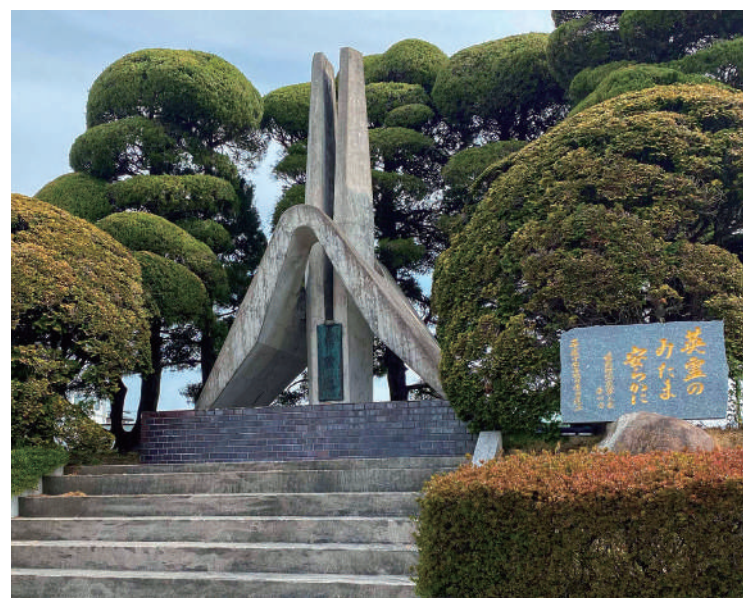
▲平和の尊さを後世に

と刻まれた石碑もこの慰霊塔の横に建てられています。 新たに嬉野市の中央広場に建てられ、鎮魂碑が新しくなりますが、嬉野でも大勢の方が戦争で亡くなられていることを決