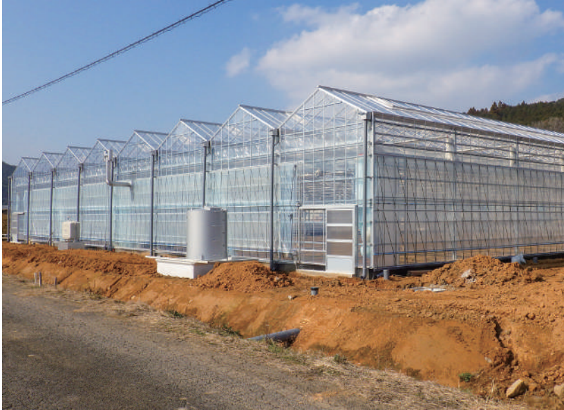
▲整備が進むハウス団地

追加補正額の内訳としては、きゅうり低コスト耐候性ハウス6億4605万円、トマト低コスト耐候性ハウス1億4065万円、育苗ハウス1億2200万円の3件分と