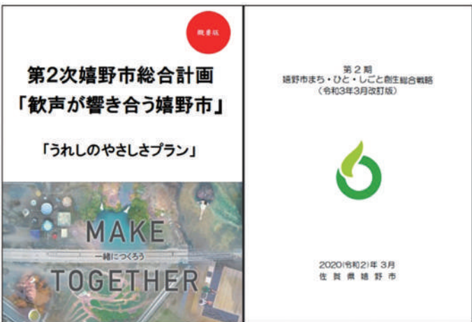
▲市活性化と市民福祉向上のための各種計画書