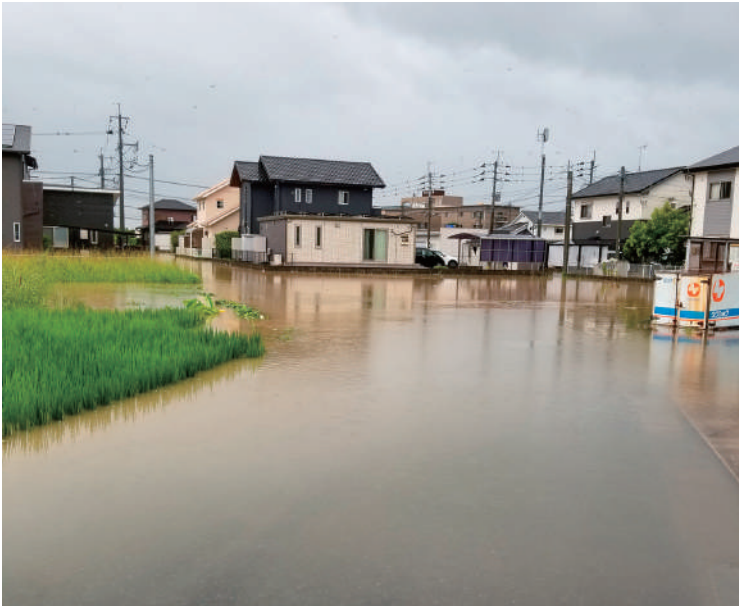
▲急がれる浸水対策