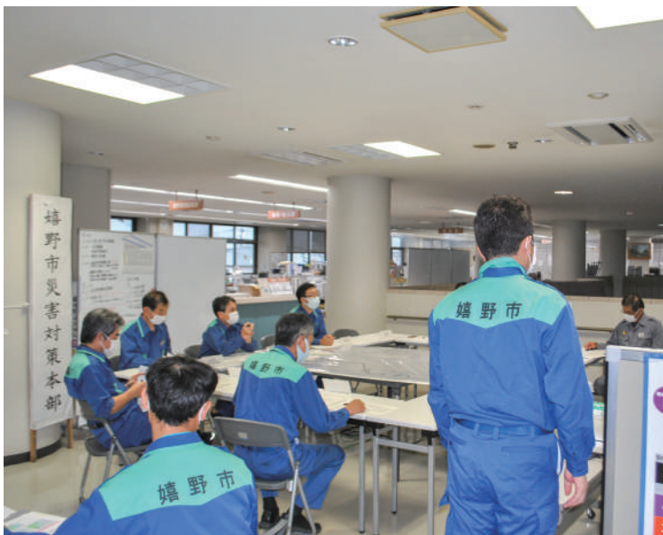
▲スムーズな災害対応のために

とと、膨大な情報の共有化を図ることができます。さらに、災害情報の取りまとめや、発生後の災害などの対応状況の振り返りがおこなえます。また、資料作成なども容易にできるシステムです。 市長が掲げる政策の「守る」という観点や、防災DXの一環として導入されるシステムです。 今後はこのシステムの有効活用をさらに図ることにより、発生した災害