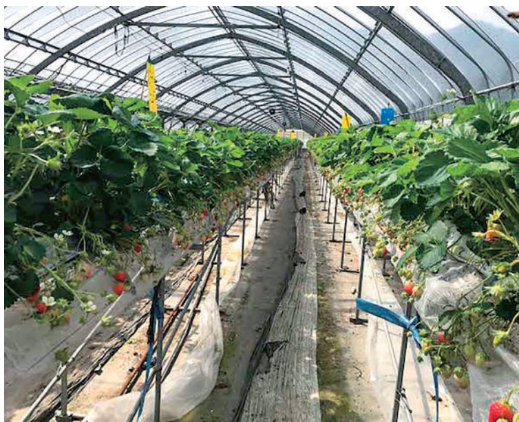
▲これからのハウス農業に支援を

は新規就農者に対して資材購入に50万円、基盤整備に対して150万円を補助している。