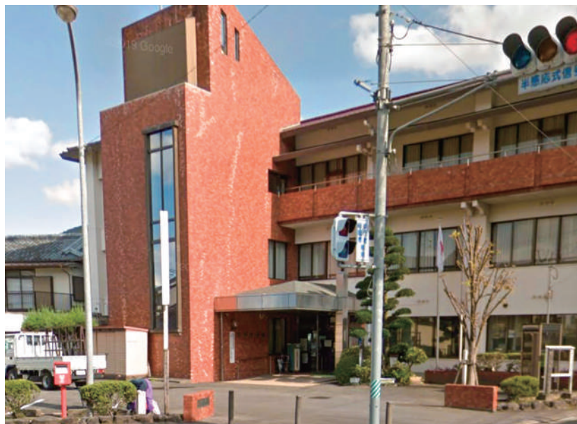
▲安心安全な避難所を

市長 うまかもん給食の材料費を農業政策課の予算の中で計上し、地場産の農産物を購入することにより、実質的に給食費の負担軽減になっている。