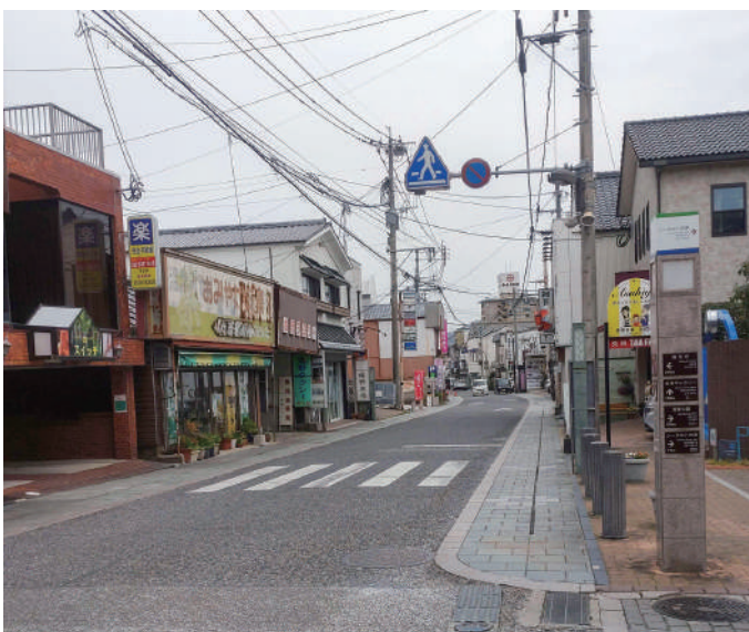
▲商店街の活性化を

市長 当面の道路行政としては、最優先事項として粘り強く一日も早く着工できるように、努力していく。