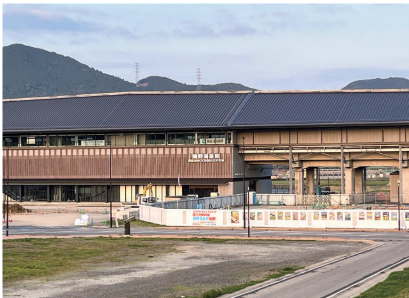
▲「おもてなし」に磨きをかけよ

この事業は、西九州新幹線嬉野温泉駅開業を目前に、本市の観光資源を磨き上げ、受入態勢を整えるとともに、開業に向けた市民の機運醸成を図る事業です。内容としては、事業者や各団体が自ら創意工夫を持って取り組む事業に