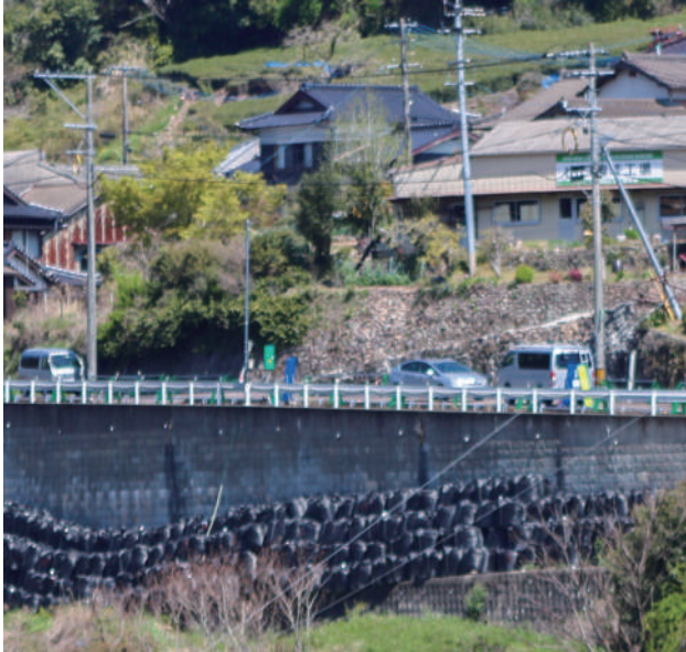
▲今後の大雨が心配