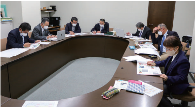
▲議会だよりの製作中

議会広報編集特別委員会は、議会に対する市民の理解と認識を深め、開かれた議会の充実を図るため、年4回の定例会後に「議会だより」を発行しています。 原稿制作から編集、校正まですべてを議員だけでおこなない広報紙を発行するのは全国でも珍しく、他自治体からも高い評価を受けています。