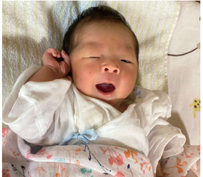
▲誕生日おめでとう

古川 市として子どもの誕生を祝い、出産祝いを贈ることはできないか。 市長 子どもたちはま