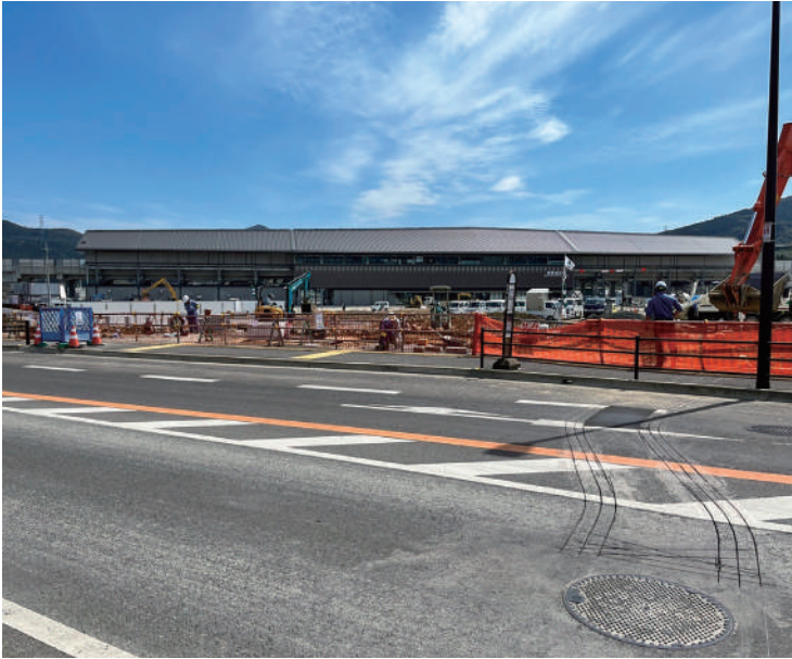
▲開業してからが大事