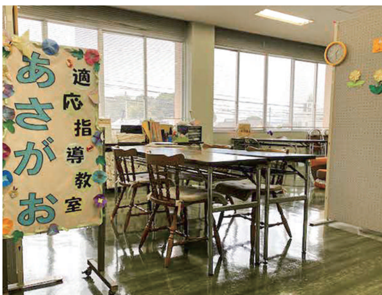
▲コーディネーターとの連携に期待

不登校対応コーディネーターは、教育委員会を拠点にして、嬉野市全体の対応にあたります。学校の支援員との連携により、教室復帰のサポートをおこないます。また、定期的に教育相談部会を開き、不登校児童生徒の対応を検討します。そして、ケース会議での指導、