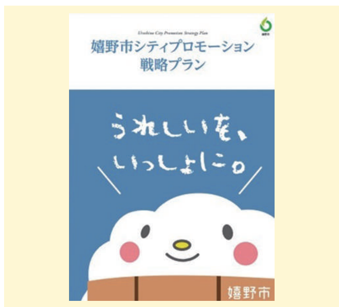
▲力づよい政策の実施を