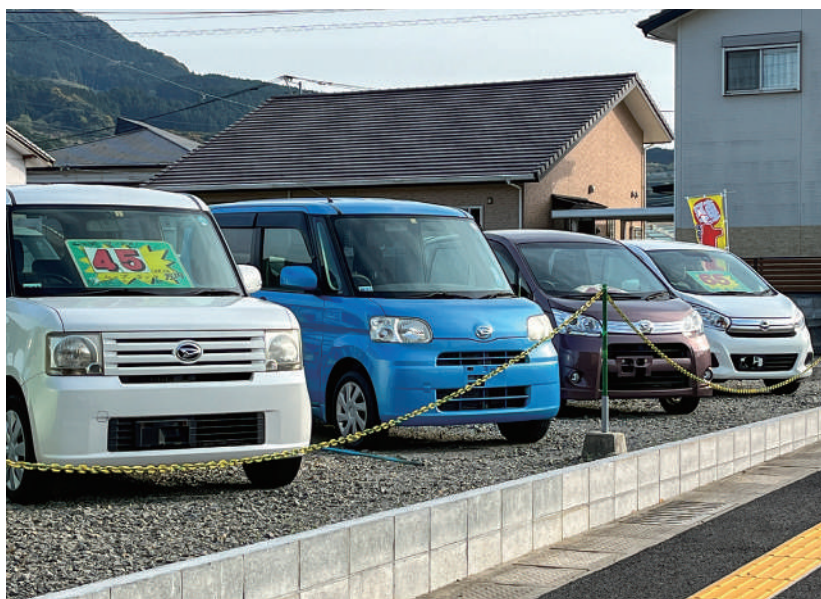
▲公平化をはかるため

み検討した結果、今回の条例改正へと至りました。商品および、展示車両の軽自動車税の免除は、全国的にも多数の自治体で実施されており、県内のいくつかの市町においても、課税免税が実施されています。 問 対象となる商品軽自動車とは何か。 答 中古自動車販売業者名義で届出されている商 問 品軽自動車（展示車両）であり、代車などにおいても使用しない軽自動車である。 問 免税率はどれくらいか。 答 100%である。 問 今回の条例の一部改正により、いつから課税免除になるのか。 答 令和4年度から適用である。