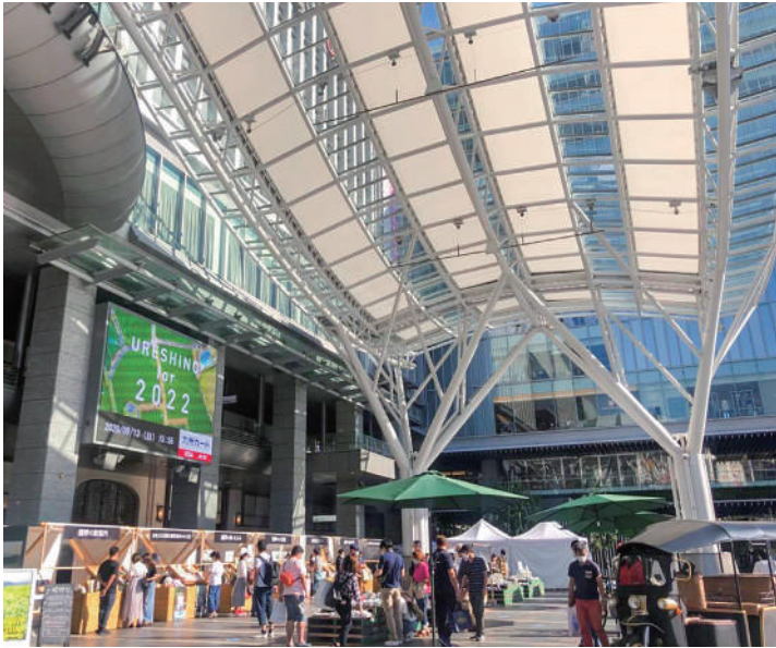
▲積極的な売りこみを

西九州新幹線（武雄温泉駅―長崎駅）の開業が令和4年9月23日に決定しました。それに伴い、豊かな自然や多様な食などの様々な魅力で、全国から来訪者を迎える国内最大規模となる観光キャンペーン「佐賀・長崎デ