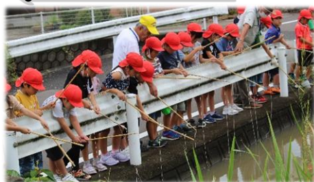
サポーターさんたちがいるから安心して釣れます。大漁でした